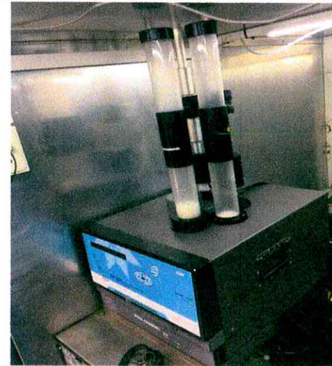
Vista interior del analizador de material particulado