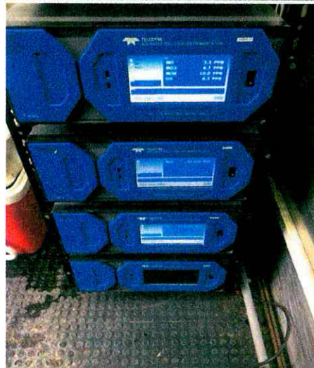
Vista interior de los analizadores de gases