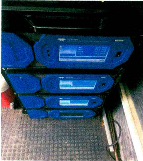
Vista interior de los analizadores de gases