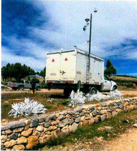
Vista lateral de la estación de calidad del aire.