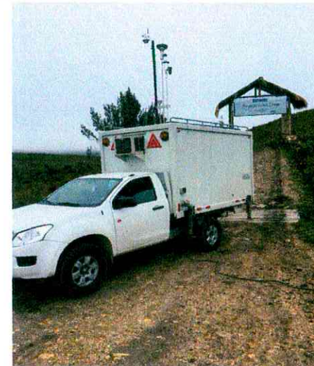
Vista frontal de la estación de calidad del aire