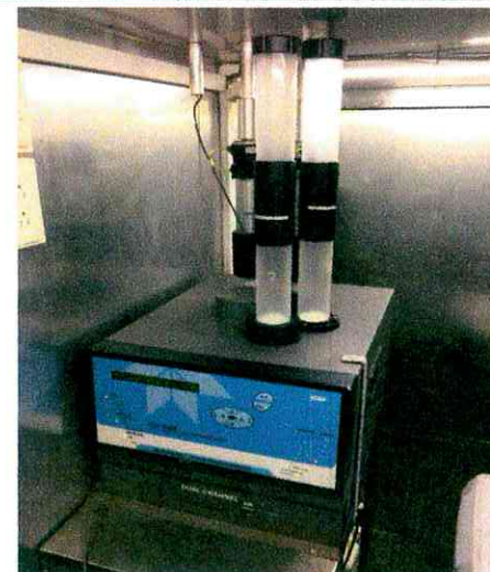
Vista interior del analizador de material particulado